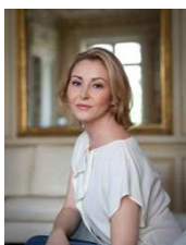
Karine Deshayes, mezzo-soprano

Après ses études au conservatoire de Paris, Karine Deshayes intègre la troupe de l'Opéra de Lyon. Elle est ensuite invitée à l'Opéra National de Paris, au Grand Théâtre de Bordeaux, au Capitole de Toulouse, à l'Opéra National du Rhin à Strasbourg, au Théâtre du Capitole de Toulouse, à l'Esplanade de Saint Etienne, à l'Opéra d'Avignon, ou encore à l'Opéra National de Bordeaux.