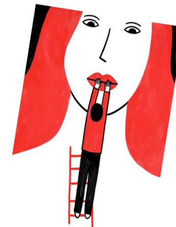
Illustration: Lorraine Sorlet

Partout dans le monde ! Everywhere in the world!